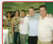
"Derruba, mas não cai" Vice-campeã