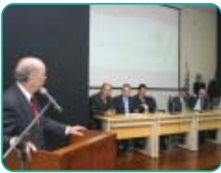
Governador José Serra

O Programa Habitacional de Integração (PHAI) está em fase nova, com opções de cartas de crédito imobiliário para cidades do