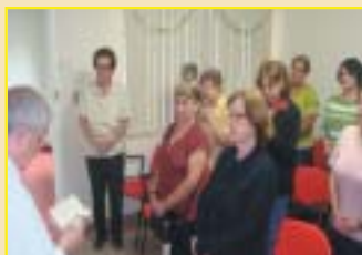
São José dos Campos: benção comemorativa.