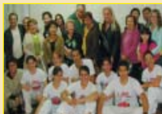
Presidente Prudente: Dia do Folclore, apresentação do Grupo de Capoeira Muzenza.