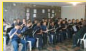
Piracicaba: Banda da Guarda Mirim de Piracicaba