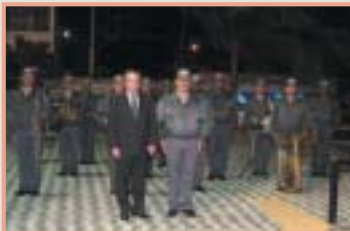
Momentos marcantes da abertura do 1º Encontro