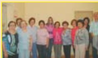
São Carlos: associadas na palestra sobre qualidade de vida.