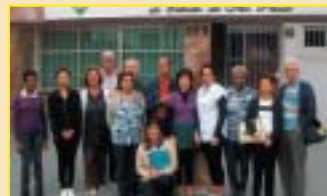
São Bernardo Campos: excursão à Holambra