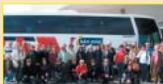
Sorocaba: associadas na excursão à URL de Campos do Jordão