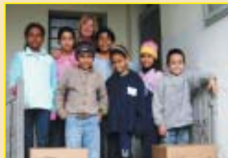
Taubaté: ação solidária, doação de alimentos para o Lar Escola Santa Verônica