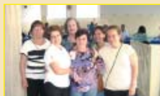
Franca: associadas no Lar de Ofélia, em atividade em homenagem ao Dia do Idoso.