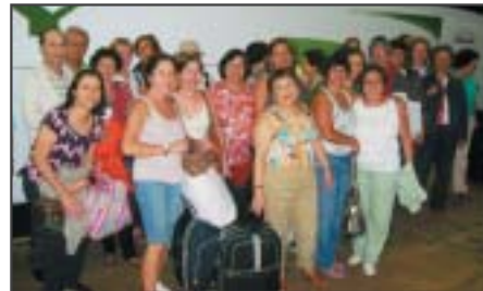
Araraquara: excursão à URL de Guarujá.