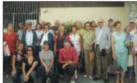
Taubaté: excursão à URL de Poços de Caldas.