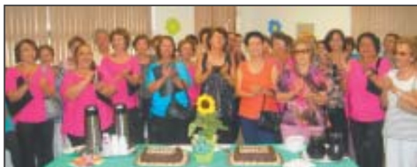
Nas fotos acima, ordem decrescente: platéia da abertura da exposição “78 anos da AFPESP”; almoço na Sede Social, dia 6 de novembro, com mais de 1.500 associados e a comemoração na Regional de Bauru, com apresentação do Coral “Luz” da Fundação Cesp e do Coral do CPP - Centro do Professorado Paulista.