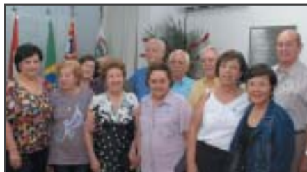
Grupo de associados homenageados

Também destacou que a AFPEPSP une os servidores públicos das diversas carreiras. "A comemoração é muito merecida, pois milhares de servidores por 40, 50 anos ou mais sempre