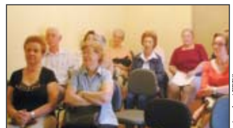
São Carlos: palestra sobre meio ambiente.