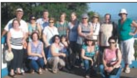
São José dos Campos: excursão à URL de Avaré.