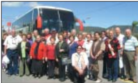
Piracicaba: excursão à URL de Ubatuba.