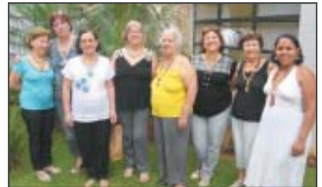
Bauru: curso de bio-jóia, com materiais naturais.