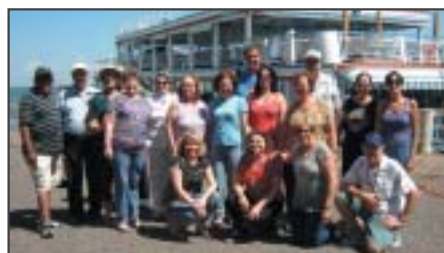
Marília: excursão - Barco Odisséia/Buritama.