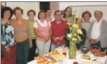
Bragança Paulista: comemoração pelo Dia do Servidor.