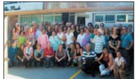
São Bernardo do Campo: excursão ao show do Leonardo.