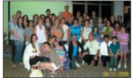
Teatro: associados em passeio à São Paulo para assistir o musical "A Bela e a Fera".

Na área da Administração Pública, Franca também emprega milhares servidores públicos de todas as esferas de Governo.