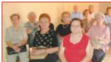
São Carlos: sessão de cinema, Dia da Família.