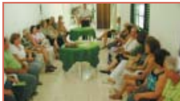
S. J. do R. Preto: 34 anos da Regional, comemorados em 17 de novembro