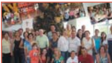
Araçatuba: associados no Guarujá (URL), dezembro, 2009.