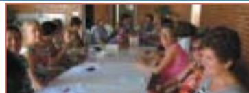
Araçatuba: Grupo da Amizade.