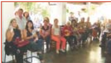
Marília: associados em confraternização, dezembro, 2009.