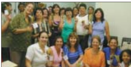
Guarulhos: servidoras públicas associadas comemoram.