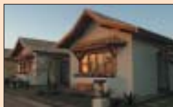
SP-URL de Avaré - 6 noites*

Excursão para o período 11 a 16/05/2010, retornando no dia 17/05, após o café da manhã.