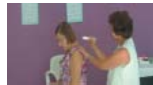
Osasco: mais de cem associadas participaram das atividades, incluindo massagens e tratamento de beleza.