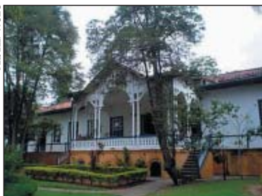
Hotel Solar das Andorinhas