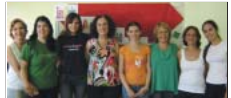
Ribeirão Preto: aula de automaquiagem.