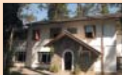
SP-URL Campos do Jordão

Passeio de 01 dia Associado ou Dependente 2x de R$ 55,00 Convidado 2x de R$ 75,00