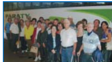
Araraquara: excursão à URL de Poços de Caldas, em março.