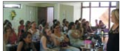
Presidente Prudente: aula de automaquiagem.