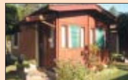
SP-URL de Lindóia

Passeio de 01 dia Associado ou Dependente 2x de R$ 55,00 Convidado 2x de R$ 75,00