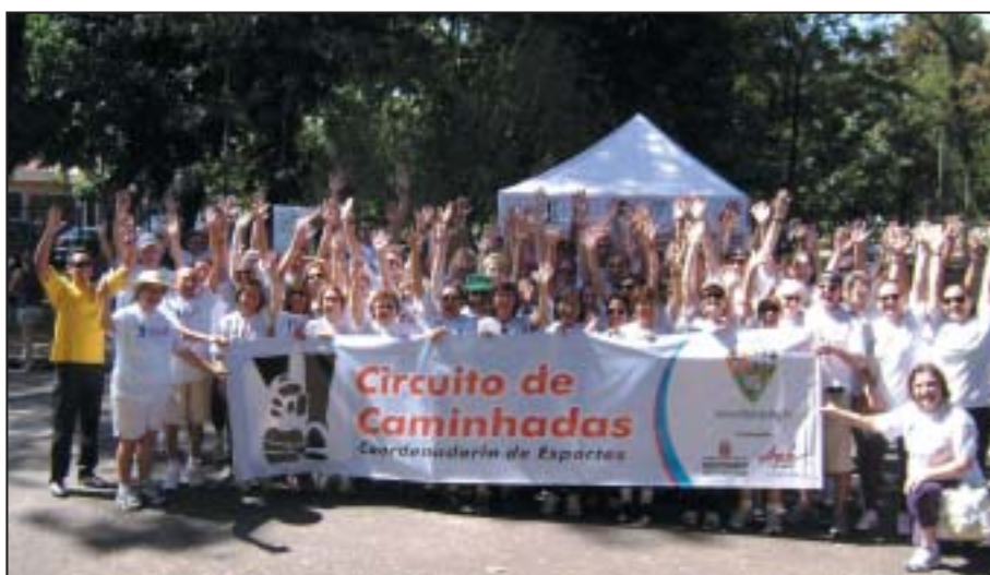
ACONTECEU: Caminhada Regional Sul - 20 de março

A Coordenadoria de Esportes agradece todos os participantes da Caminhada da Regional Sul, realizada no Parque Severo Gomes. O grupo foi formado por 93 associados, que juntos doaram 93 quilos de alimentos, destinados a entidades assistenciais.