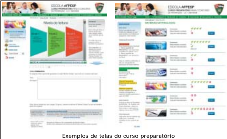
Exemplos de telas do curso preparatório

A AFPEsp inaugurou um novo serviço aos associados na área de Educação. O projeto vem sendo estudado desde 2007, quando o Presidente Antonio Luiz Ribeiro Machado definiu como uma das prioridades do Planejamento Estratégico da Associação, a criação da Escola de Administração Pública da AFPEsp. “Assumimos o compromisso de entregar aos servidores públicos uma instituição de ensino confiável e acessível, que atenda aos interesses da categoria no sentido do aperfeiçoamento e valorização profissional”, explica Ribeiro Machado.