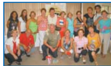
Bauru: atividade de bingo recreativo, mês de março.