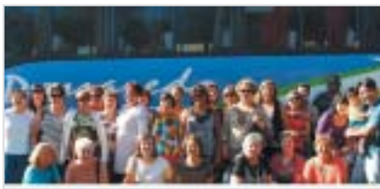
Ribeirão Preto: associados em Águas de São Pedro.