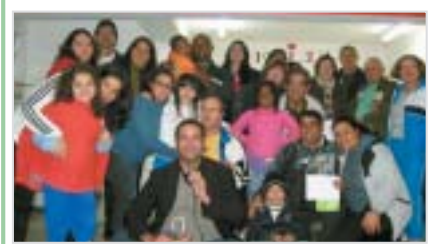
Guarulhos: homenagem aos pais.

São José do Rio Preto: 28/10, às 15h, gênero drama.