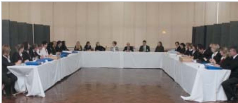
São Paulo: reunião da Coordenadoria de Associativismo na Sede da AFPEP.

A Coordenadoria de Associativismo, em 10 de agosto, promoveu a reunião anual com todos os colaboradores supervisores das Unidades Regionais da AFPEP.