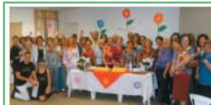
Bauri: Dia das Vovós.