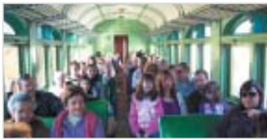
São Carlos: associados no Trem Maria Fumaça.