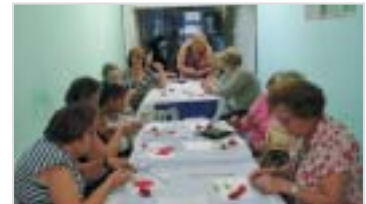
Osasco: artesanato do Dia da Vovó.