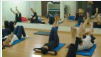
Presidente Prudente: aula de Pilates

Dança Flamenca, períodos manhã e tarde. Informe-se.