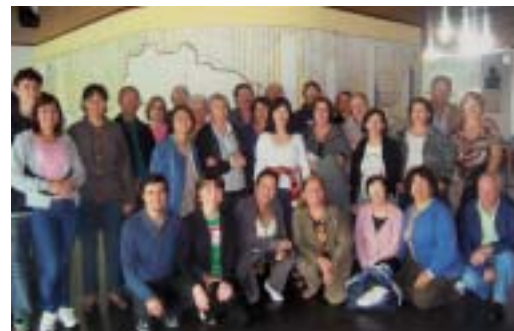
Araçatuba: excursão à URL do Guarujá, 11 a 15/09.

Grupo da Amizade , reunião toda primeira 5ª feira do mês, às 15h; Jogo de Buraco , 2ª feiras, às 13h.