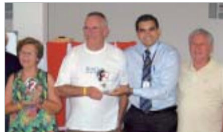
Piracicaba: dupla vencedora.