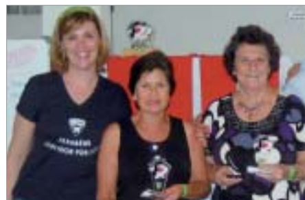
Piracicaba: dupla vice-campeã, ao lado da Supervisora.