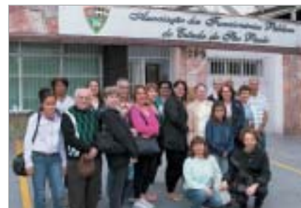
São Bernardo do Campo: excursão à Holambra.