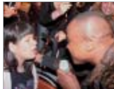
Atenção do cantor com a plateia