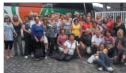
São José do Rio Preto: excursão à Ubatuba.