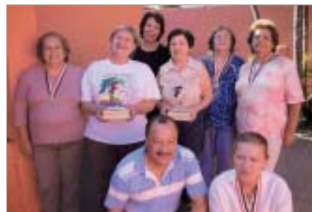
São Carlos: finalistas.