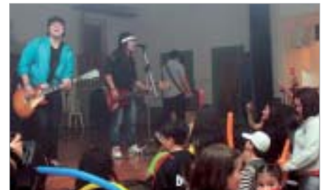
São Paulo: Banda República 103 agrada crianças, adolescentes e adultos.

Em Presidente Prudente e Guarulhos, a comemoração reuniu filhos e netos de associados, bem como nas demais Unidades Regionais.