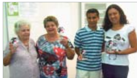
Santos: duplas vencedoras.