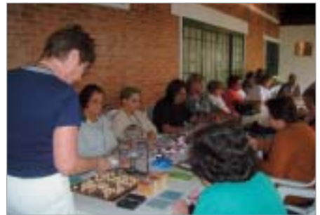
Araraquara: grupo da amizade, atividade recreativa.