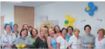
Bauru: comemoração pelos seis anos da Unidade Regional Padrão da Associação.

Confira a programação esportiva das Unidades Regionais no site www.afpep.org.br