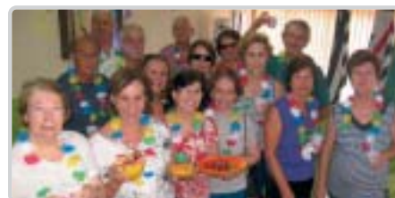
Piracicaba: festa havaiana.

Academia - 2ª a 6ª, das 7h30 às 19h30; Yoga - 2ª e 4ª/ 3ª e 5ª feira, 8h30 às 12h30 e 15h30 às 19h30; Dança Flamenca - 6ª feira, manhã e tarde.