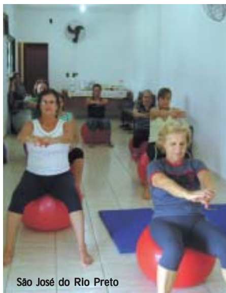
São José do Rio Preto