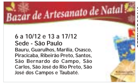
Conforme divulgamos em edições passadas

Trabalho Corporal , 4ª feira, das 9 às 10h30.