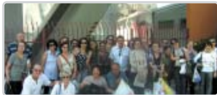
Taubaté: excursão à São Paulo.

Informática , curso básico/ Microlins; Curso de Memória , com a Professora Bete (Sesi). Informe-se.