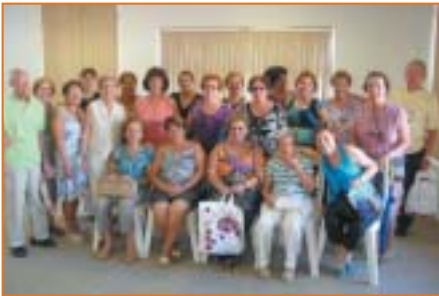
Bauru: associados em 10/02, Bingo Recreativo.