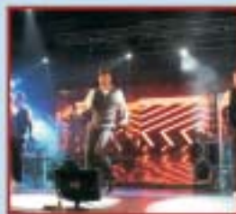
CONVITE PARA FESTIVIDADES DOS 80 ANOS