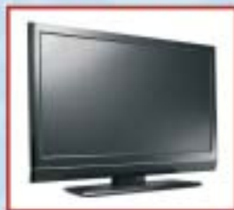
TV LCD 32"