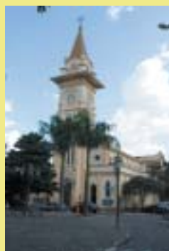
URL de Socorro