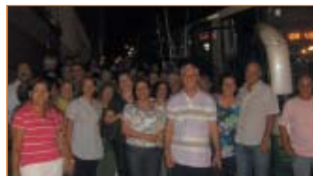
Presidente Prudente: aproximadamente 80 associados participaram da excursão à URL do Guarujá.

30/04, Maria Fumaça (1 dia), com compras em Pedreira; 28/05, Campos do Jordão (1 dia).