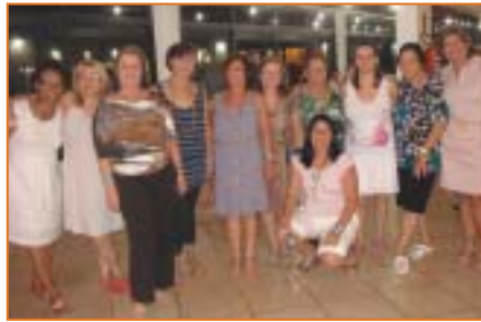
Araçatuba: excursão à URL de Socorro.