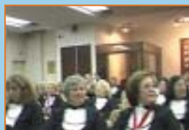
2006: Sessão de posse de membros da Academia de Letras, Ciências e Artes da AFPESP.