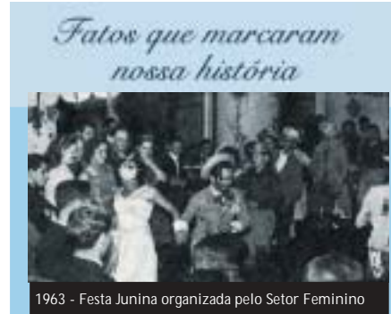
1963 - Festa Junina organizada pelo Setor Feminino

Se você faz parte de uma família que possui mais de duas gerações de associados, isto é, avô, pai e filho, conte para nós a sua história junto à AFPESP. Queremos conhecer as famílias que são associados fiéis da Associação por várias gerações. Escreva no endereço: “Painel do Leitor/ AFPESP por várias gerações”, à Rua Dr. Bettencourt Rodrigues, 155, 9º andar, São Paulo, 01017-909. Ou se preferir envie um e-mail para: folhadoservidor@afpesp.org.br. A sua história poderá ser publicada neste jornal, a partir de janeiro 2011. Envie seu nome completo, telefone ou e-mail de contato.