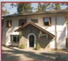
ESCOLHA A LRE DE SUA PREFERÊNCIA.

Crie um slogan para os 80 anos da AFPESP e concorra: