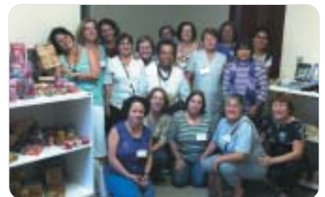
São José dos Campos: artesãos elogiam a organização do bazar.