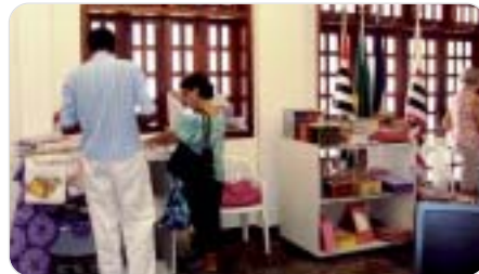
Ribeirão Preto: associados aproveitam o bazar.