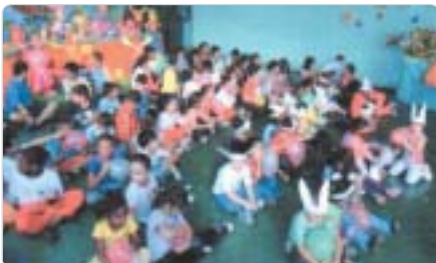
Osasco: 4º Páscoa Solidária leva alegria ao Centro Social Santo Antonio, com doações de associados e parceria da Dori Doces, Kim Supermercado, Anna Nery Decorações e Everest Car.