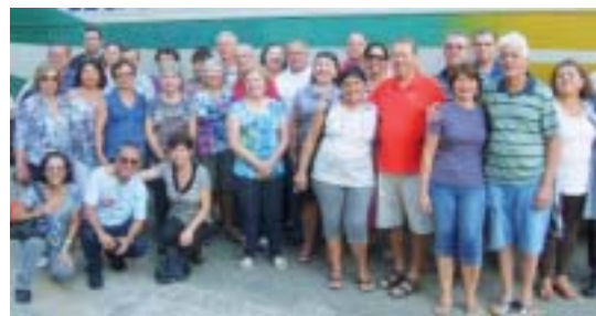
Presidente Prudente: Associados que estiveram em excursão para Ubatuba