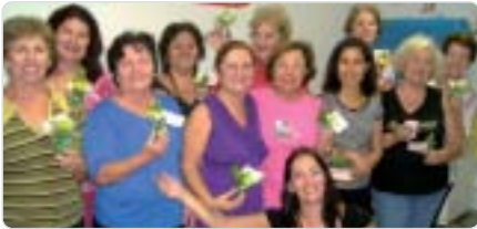
Santos: comemoração das mães/turma das Danças Circulares

Na Sede Social e nas Regionais, em diversas atividades, o Dia das Mães foi comemorado. São Paulo, em 6 de maio, houve um almoço festivo. Na Regional de Bauru, por exemplo, o Coral do CPP fez uma apresentação especial. Nesta página, destacamos algumas atividades e agradecemos a participação de todos os associados, nesta programação especial.