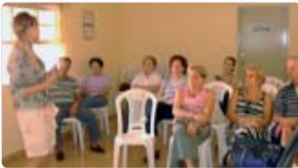
São Carlos: palestra sobre estresse.