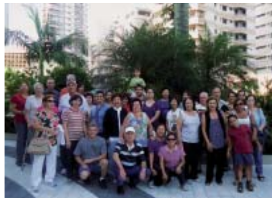
Araçatuba: Excursão de associados à URL do Guarujá, final de abril e começo de maio.

Franca promove curso de inclusão digital para associados da Melhor Idade, em parceria com Centro Universitário de Franca (Uni-FACEF). Os associados, às 4ª feiras podem assistir às aulas. Esta atividade visa permitir a ampliação do conhecimento em informática, uma ferramenta essencial na atualidade.