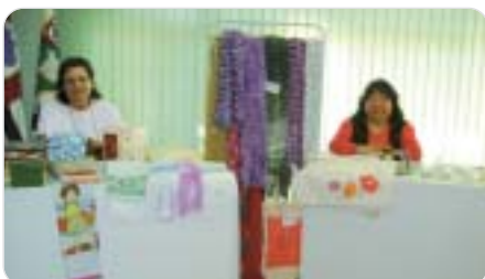
Guarulhos: algumas expositoras do bazar.