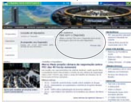
2ª Tela: Selecione "Fale com o Deputado"