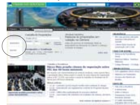
1ª tela: www.camara.gov.br - selecione "Deputados"