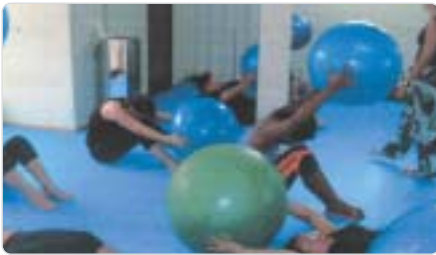
Presidente Prudente: Pilates - mais de cem alunos.