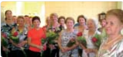
São Carlos: homenagem às mães.

Na Sede Social e nas Regionais, em diversas atividades, o Dia das Mães foi comemorado. São Paulo, em 6 de maio, houve um almoço festivo. Na Regional de Bauru, por exemplo, o Coral do CPP fez uma apresentação especial. Nesta página, destacamos algumas atividades e agradecemos a participação de todos os associados, nesta programação especial.