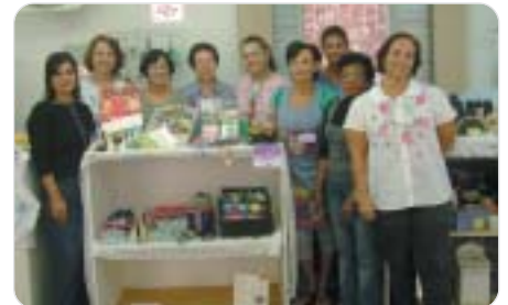
Santos: associadas mostram seus trabalhos.