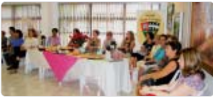
Bauru: café da manhã para as mães.