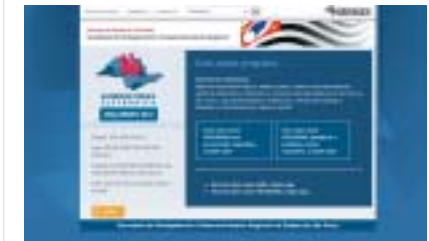
Quando for votar neste programa, selecione a opção com sugestões a direita na tela. Inclua a proposta de recursos ao IAMSPE.