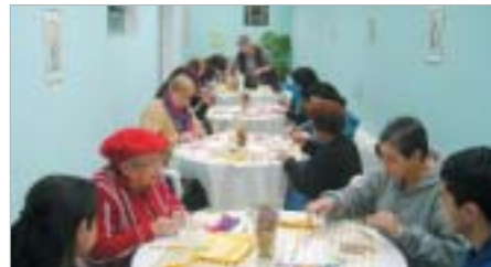
Osasco: comemoração do Dia das Avós.