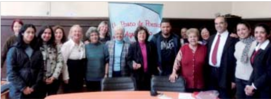
Secretaria da Educação