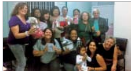
Guarulhos: homenagem às avós.