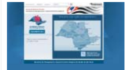
No mapa de São Paulo, escolha região metropolitana da capital e depois escolha Secretaria de Gestão Pública.