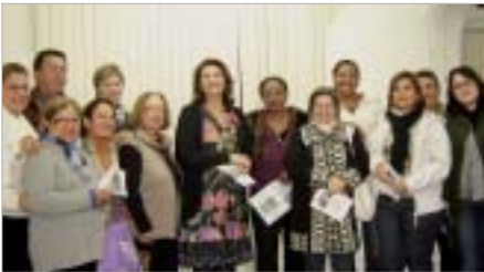
Marília: abertura de exposição