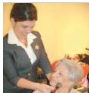
São Carlos- Dia da Vovó