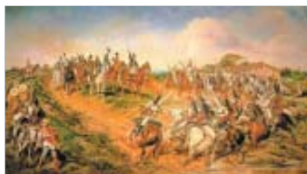
"O grito do Ipiranga", pintura de Pedro Américo, no Museu do Ipiranga, em São Paulo.