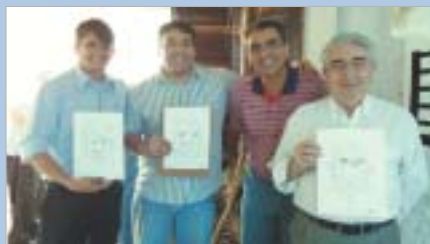
Osasco: almoço comemorativo e caricaturas dos pais.