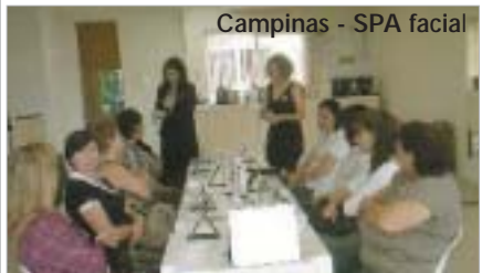
Campinas - SPA facial