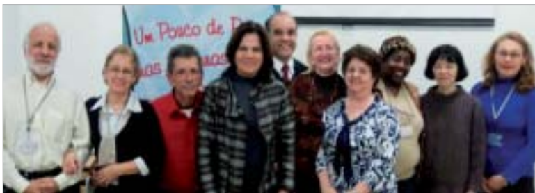
Secretaria da Fazenda