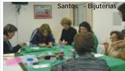
Santos - Bijuterias

As Regionais promovem atividades culturais, sociais e de lazer. Os eventos relacionados à moda e estética ganham sempre novos adeptos. Cursos de bijuterias e automaquagem atraem associados.