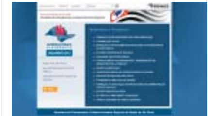
Na tela seguinte escolha o programa "Assistência Médica ao servidor Público Estadual"