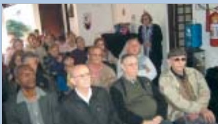
Marília: palestra e confraternização reúne dezenas de pais.