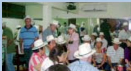
Presidente Prudente: pais participam de evento country.