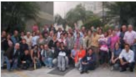
Araçatuba: passeio em agosto à URL do Guarujá