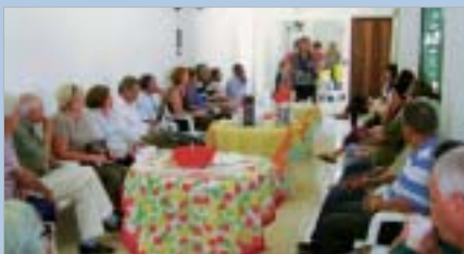
São José do Rio Preto: palestra celebra o Dia dos Pais