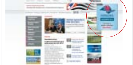
Acesse o site www.planejamento.sp.gov.br clique no pop-up