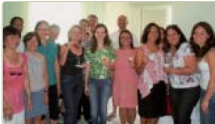
Guarulhos: associados em café da manhã

Acompanhe a programação completa das Regionais no site: www.afpesp.org.br