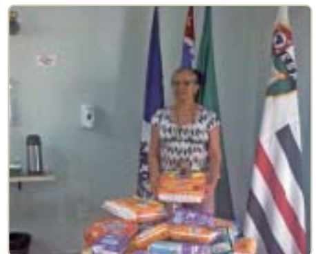
Guarulhos: a representante da entidade AGAM recebe fraldas que foram os donativos dos associados da Regional.