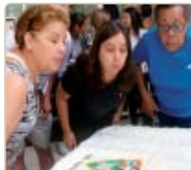
Campinas: parabéns dos associados, plantio de uma muda de Carvalho e distribuição de mudas de Cedro.