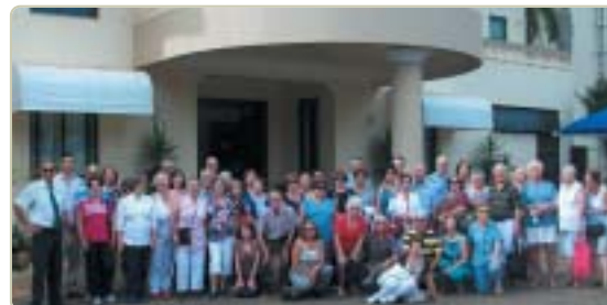
Sorocaba: associados na URL de Ibirá

Grupo de Cartas, juntamente com o grupo da Amizade, reuniões todas as 5ª feiras, a partir das 14h30; Esportes, lista de interessados para Sala de Condicionamento Físico.