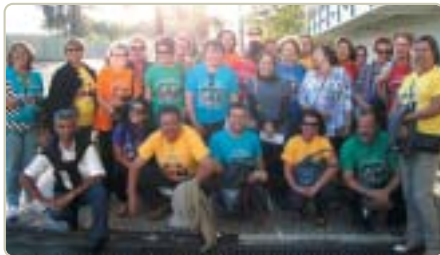
São Carlos: caravana ao show de Victor e Leo.