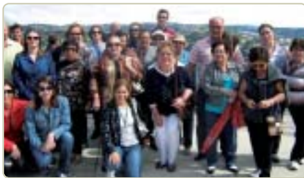
Araçatuba: associados em Campos do Jordão