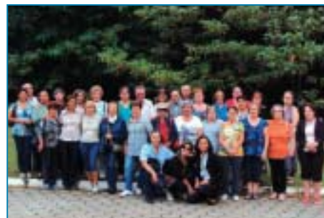
URL de Serra Negra recebe excursão de S. J. dos Campos