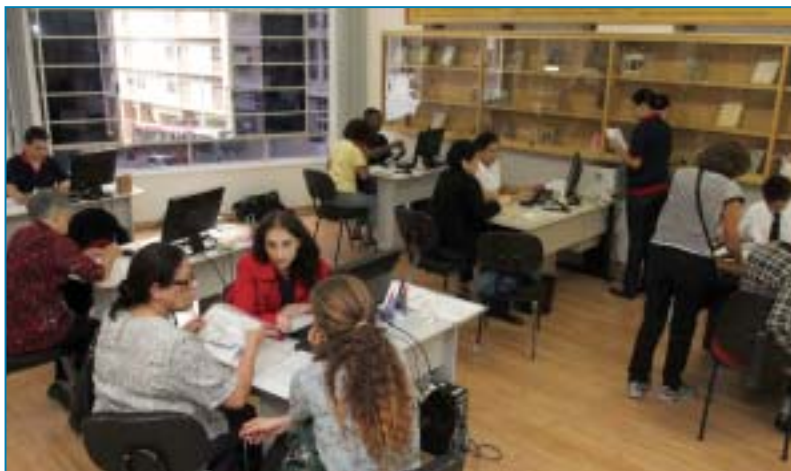
São Paulo - Unidade Venceslau Brás (Sé)