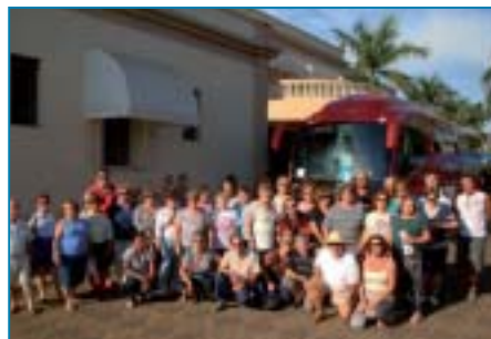
Associados de Santos na URL Termas de Ibirá