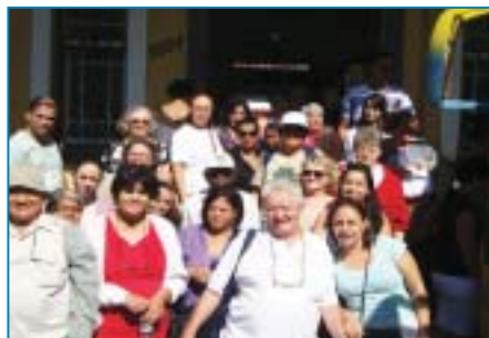
Associados de Osasco no passeio à Maria Fumaça

São José do Rio Preto: Centro de Beleza: cabelo, manicure, pedicure e esteticista, de 2ª a 6ª feira, das 8h30 às 17h.