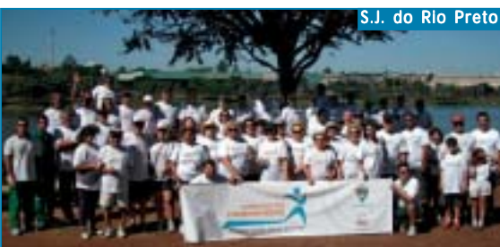
S.J. do Rio Preto