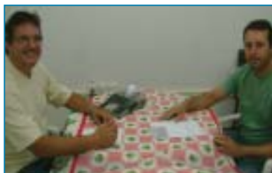
São José do Rio Preto

Garanta a segurança de sua família! Descontos extensivos aos pais, cônjuge e filhos.