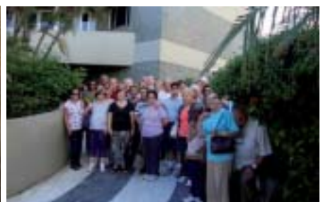
São Carlos: associados na URL do Guarujá