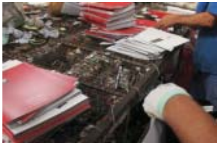
Seleção manual dos materiais na cooperativa