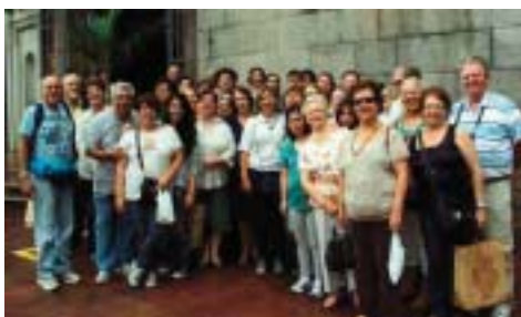
Bragança Paulista: associados visitam a capital paulista

Os interessados podem contatar o Setor de Reservas para obter informações da disponibilidade de vagas (reservas@afpep.org.br)