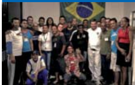
Osasco: atividade solidária no GOAS