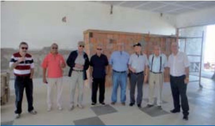
Presidente, diretores e coordenadores