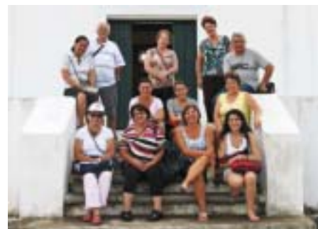
Bragança Paulista: associados em Santos

Unidade Sul: Curso de Inglês , 3ª e 5ª feiras, 9 às 10h; 10 às 11h; 14 às 15h e 15 às 16h