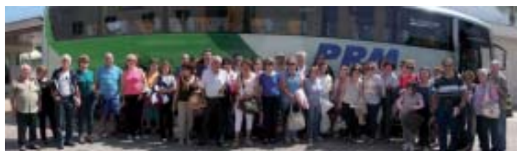
Sorocaba: associados em excursão à Ubatuba

São José do Rio Preto: Centro de Beleza: cabelo, manicure, pedicure e esteticista, de 2ª a 6ª feira, das 8h30 às 17h.