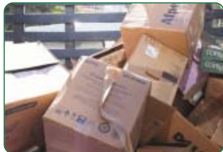
Retirada da Sede Social