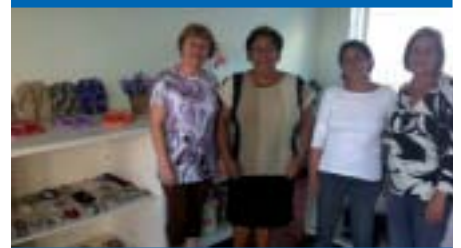
SÃO JOSÉ DOS CAMPOS