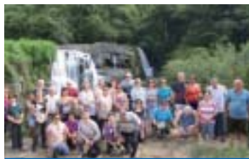
Araçatuba: associados em Poços de Caldas, na cachoeira Vêu das Noivas