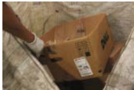
Ciclo dos recicláveis: separação na Sede Social

A AFPESP, neste 5 de junho, Dia Mundial do Meio Ambiente, se une a centenas de outras instituições e pode comemorar suas ações em prol do Meio Ambiente. Os conceitos de sustentabilidade, preservação e reciclagem são componentes do planejamento de ações da entidade.