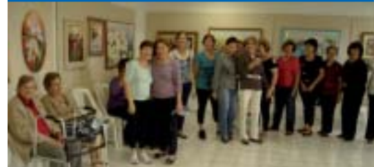
BAURU: café da manhã especial às mães