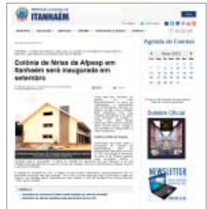
Acima, notícia no site da Prefeitura