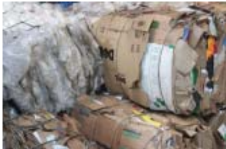
Material prensado na cooperativa