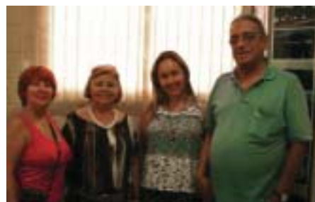
São Carlos: workshop de fotografia