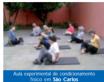
Aula experimental de condicionamento físico em São Carlos

Unidade Sul: Danças Rítmicas, horário das 11 às 12h. Informe-se.