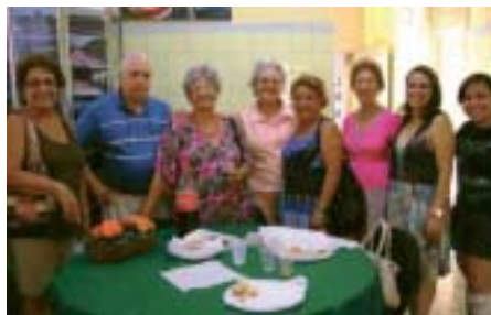
São Carlos palestra sobre a massagem e seus benefícios

São José dos Campos: 2 a 6/07 , Revolução Constitucionalista; 5/07 , comemoração de Aniversário do Grupo da Amizade (6 anos); 23 a 27/07 comemoração de Aniversário da cidade (245 anos); 25/07 , comemoração Dia da Vovó (Tarde de Bingo Recreativo, às 15h).