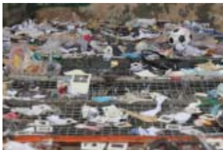
Esteira trituradora da cooperativa