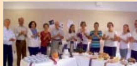
Bauru: comemoração pelo aniversário da cidade e abraço fraterno aos pais