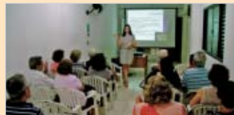
São José do Rio Preto: palestra aos pais.