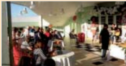
Botucatu: reunião de associados para comemorar o Dia dos Pais