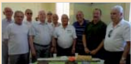
São Carlos: reunião comemorativa dos associados.