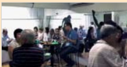
Presidente Prudente: comemoração dos pais e familiares.