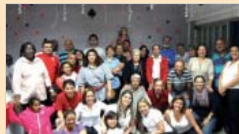
Osasco: comemoração dos pais e familiares.