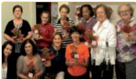
Bragança Paulista: comemoração pela Primavera

Araraquara: Todas às 6ªs feiras, às 14h30min, Troca de Aprendizado: ponto cruz, oitinho, vagonite e tricô. Osasco: Curso Técnicas em Madeira, informe-se. São José do Rio Preto: Lista de interessados para cursos de artesanato.