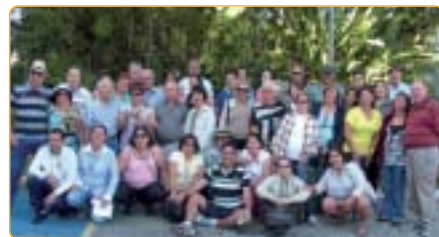
Araçatuba: excursão para Ubatuba

Sujeito a alterações Araçatuba: Excursões, informe-se na Regional Araraquara: Dezembro , URL de Ubatuba e excursão Maria Fumaça/ Jaguariúna (compras em Pedreira). Bauru: 6 a 10/12 , URL de Campos do Jordão. Bragança Paulista: Dezembro , URL de Areado Botucatu: 15/12 , URL de Avaré. Campinas: 2/12 , Hatha Yoga (CCN); 1,8,15/12 , Natal Luz (SP); 8/12 , compras (SP) Franca: 2 a 6/12 , Caldas Novas - Hotel Thermas Di Roma; Janeiro/2013 , Serras Gaúchas; Fevereiro/2013 , UR L do Guarujá. Piracicaba: 6 a 10/12 , URL do Guarujá. São Bernardo do Campo: 8/12 , Campos do Jordão (1 dia). São José do Rio Preto: Dezembro , URL de Campos do Jordão; Passeio de 1 dia na URL de Ibirá; URIs de Areado e Avaré (lista de interessados/ inscrição sem sorteio). Sorocaba: Janeiro , Maria Fumaça (Pedreira).