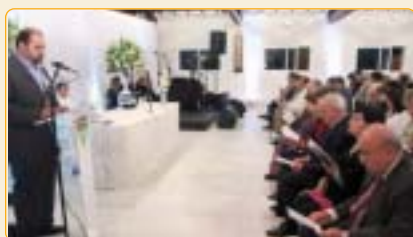
Membros da Diretoria, Coordenadorias e Conselhos participam de celebração católica.