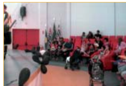
Botucatu: brincadeiras e festa no auditório da Regional