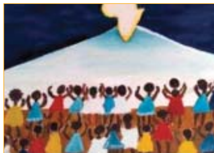
Tela: Negras imagens de Zul

Ora, desde o período colonial, a organização familiar dos negros foi destrocada pelo escravismo. Aos escravizados, bem como aos seus descendentes livres foram negados o acesso a vida digna, a terra e a escola. As consequências desses atos governamentais perduram até hoje para a comunidade negra.