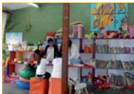
Unidade Sul - Associação Maria Helen Drexel recebe donativos

Outras Regionais como Ribeirão Preto, Bragança Paulista, Franca, Guarulhos, Osasco, Santos, São Bernardo do Campo, São José do Rio Preto e São José dos Campos promoveram atividades solidárias e de confraternização para crianças. ♦