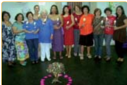
Santos: celebração pela Primavera