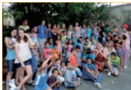
Marília: festa com as crianças do Projeto Semeando