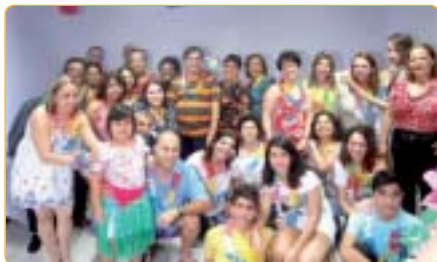
Osasco: Festa havaiana pelo aniversário da Regional