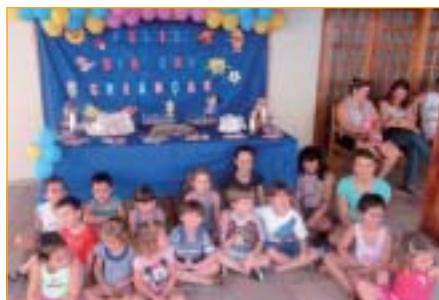
Ribeirão Preto: festa das crianças